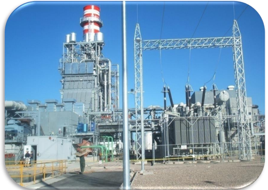
TRANSFORMADOR TURBINA DE VAPOR CCCNN NACO, NOGALES, AGUA PRIETA, SON.