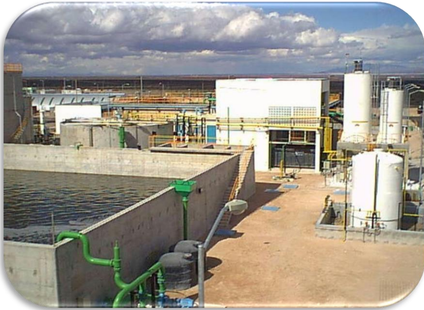
PLANTA TRATADORA DE AGUAS CCCNN NACO, NOGALES, AGUA PRIETA, SON.